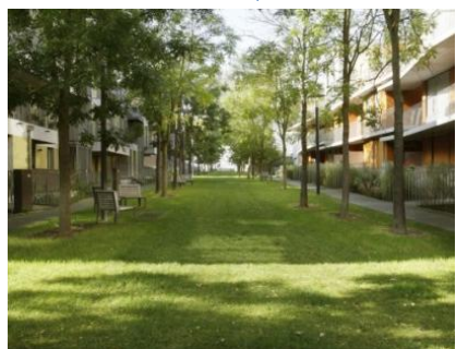
Habiter le long d'un mail