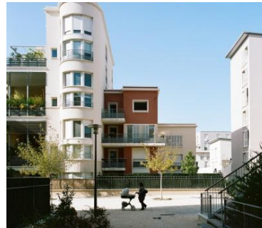
Créer des ponctuations