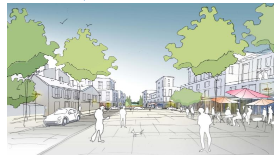
Créer de nouveaux commerces