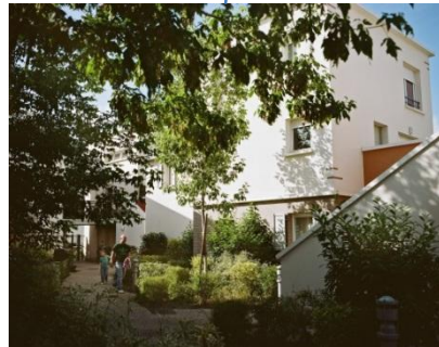
Border une venelle