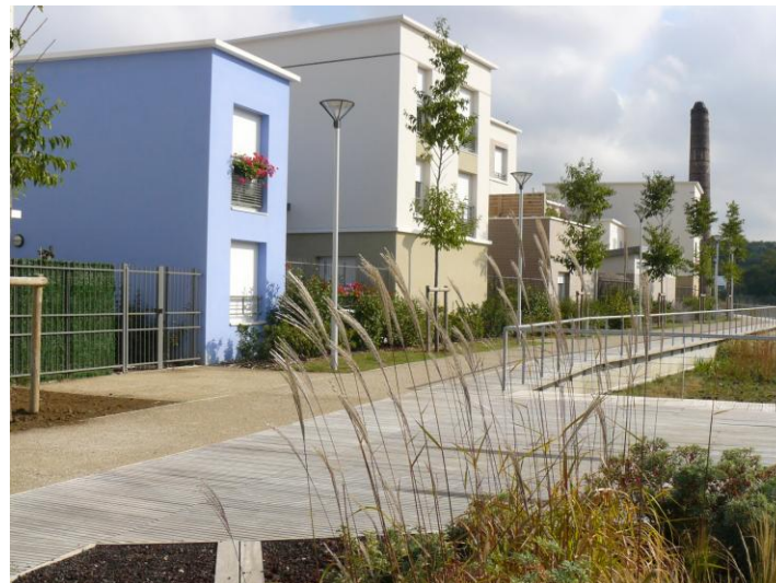
Des continuités piétonnes